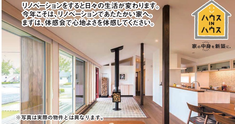
※写真は実際の物件とは異なります。

リノベーションをすると日々の生活が変わります。 今年こそは、リノベーションであたたい家へ。 まずは、体感会で心地よさを体感してください。