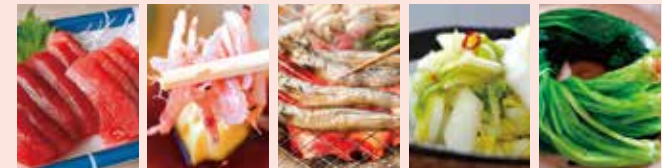
マグロ サクラエビ ししゃも 白菜 ほうれん草